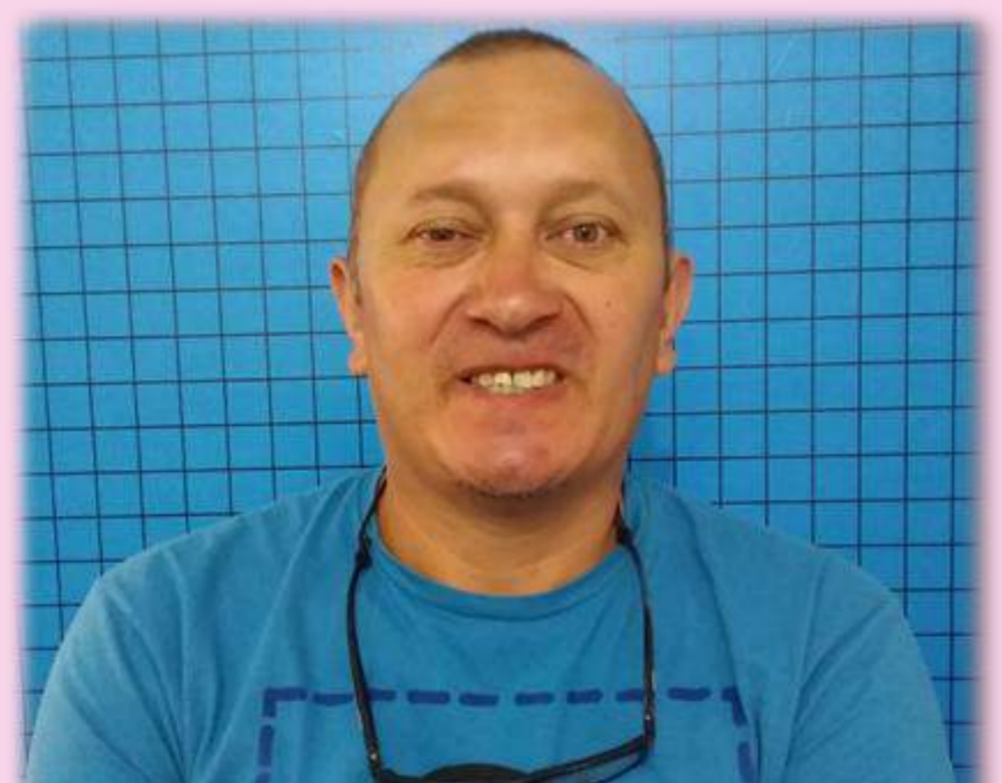
IMÁGENES COMPARATIVAS AL INICIO Y AL FINAL DEL TRATAMIENTO

Conclusiones: Frecuentemente se asume que las sincinesias faciales son secuelas de una parálisis facial periférica con daño axonal y por lo general están asociadas al uso de electroterapia, sin embargo, en este caso clínico estas se presentaron sin el uso previo de la misma. En el abordaje funcional se aplicó electroestimulación selectiva muscular, aprendizaje y ejecución de ejercicios de la mímica facial e inhibición frente a espejo, lo cual no provocó el desarrollo de las mismas; por el contrario se lograron avances funcionales en la mímica y la recuperación funcional.